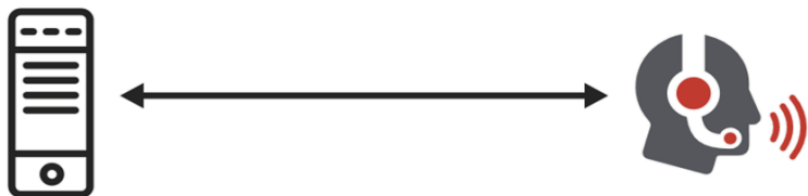
<従来の他社ボイスソリューションとのシステム構成の違い>